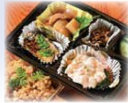
テイクアウトもOK!薬膳弁当 1,000円