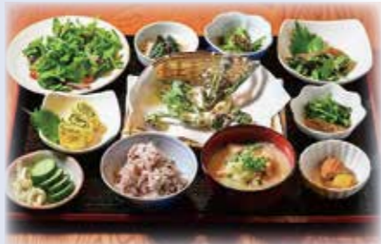
日替わり薬膳ランチ 2,000円

契約農家さんの無農薬野菜や、天然のきのこのなど、旬の食材がお盆いっぱい並び目移りするほど！一目で丁寧な仕事伝わってきます。安心安全にこだわった愛情たっぷりの薬膳料理。身体も心もほっこりする癒しのランチです♡