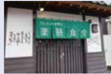
特別栽培米は、毎日使う分だけを精米。

伊勢崎市上諏訪町2113-18 営業時間 11:30~14:00 090-4540-1234 定休日 水曜・木曜