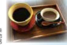
季節感のある器でおもてなし