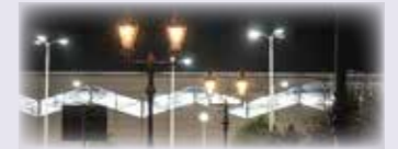
日が落ちるとノスタルジックな世界に

明治時代に登場したガス燈が、<癒しのあかり>として各地で復刻されています。伊勢崎駅のガス燈は3基。つい見過ごしてしまいそうですが、美術品のような佇まいの美しさや柔らかな光は、イルミネーションにも負けない魅力があります。