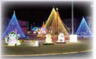
見慣れた駅前広場が幻想的な光の世界に