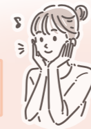
いせさき銘仙柄で美しくおめかし