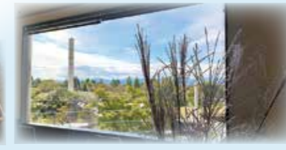
風が心地よいテラス席