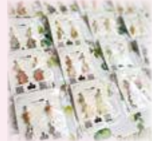
うさぎ作家さんのハンドメイド雑貨も販売中!