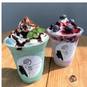
美容室「CLOCKLESS」併設のテイクアウト専門カフェ